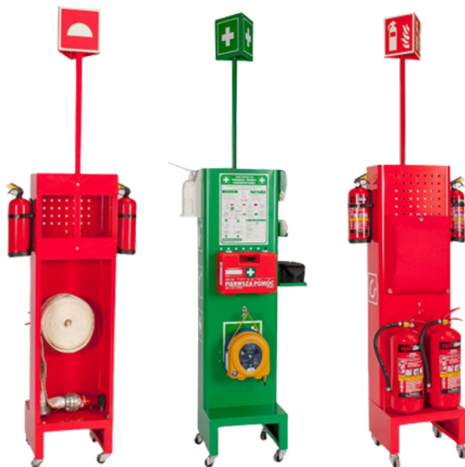
zdjęcia poglądowe stacji z wyposażeniem dodatkowym