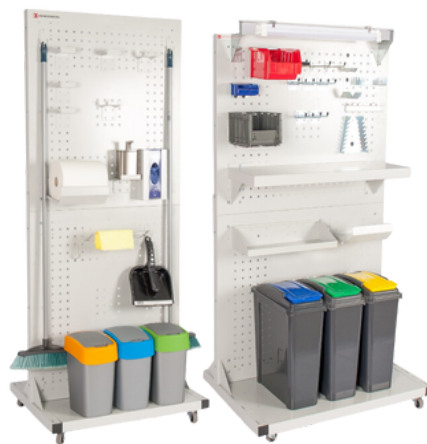
zdjęcia poglądowe stacji z wyposażeniem dodatkowym