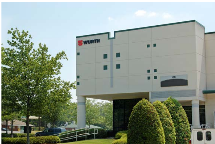
Würth Wood Group Inc. w Charlotte, USA

Nie dotyczy to okazjonalnej pracy literackiej, wykładów i innych porównywalnych działań. Zawsze z radością przyjmujemy informacje, że nasi pracownicy udzielają się w ramach wolontariatu.