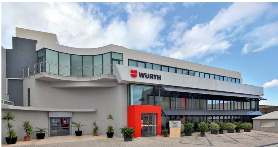
Würth Limited w Zebbug, Malta

Mamy świadomość, że odnosi się to nie tylko do towarów, których fizyczną obecność można stwierdzić, lecz również do informacji i technologii. One również nie mogą być nielegalnie przekazywane osobom trzecim. Naruszenia mogą wyrządzić Grupie Würth ogromne szkody. Zatem nalegamy, by wszyscy pracownicy wykazywali się roztropnością oraz, przykładowo, nie przekazywali bezprawnie żadnych informacji, pocztą elektroniczną lub telefonicznie. Nasi pracownicy mogą i powinni zwracać się do swoich przełożonych oraz do odpowiednich biur/departamentów, w razie jakichkolwiek pytań lub braku pewności.