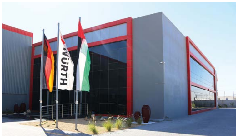
Würth Gulf FZE w Dubaju, Zjednoczone Emiraty Arabskie

Grupa Würth uznaje fakt, że pewne zasoby naturalne są ograniczone. Z tego względu, staramy się postępować z zasobami naturalnym w sposób rozważny z punktu widzenia środowiska. Oznacza to, że nie tylko przestrzegamy obowiązującego prawa ochrony środowiska oraz zrównoważonego rozwoju, lecz również staramy się unikać niepotrzebnego zużywania zasobów nieodnawialnych, gdy tylko to możliwe. Z tego względu nalegamy, by każdy pracownik stosował praktyczne środki w celu ograniczenia marnotrawstwa zasobów oraz w celu unikania powstawania zanieczyszczeń.