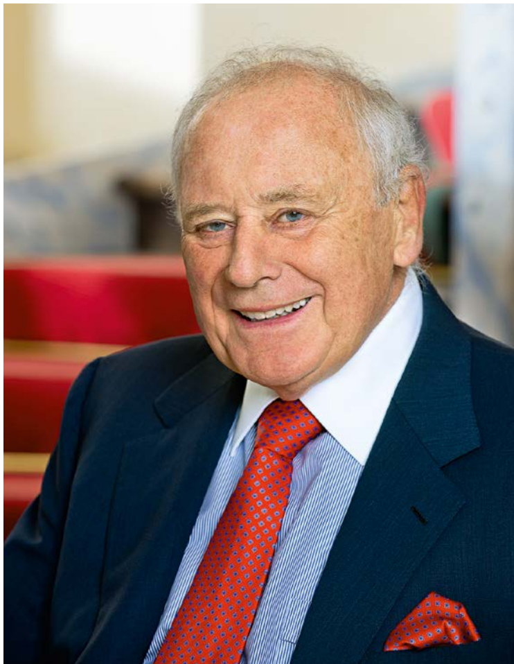
Prof. Dr. h. c. mult. Reinhold Würth, Prezes Rady Nadzorczej Trustu Rodzinnego Grupy Würth, Honorowy Przewodniczący Komitetu Doradczego Grupy Würth